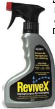
Artikel-Nr. 36331 + 36211

Der industrielle Standard zur Erhaltung der wasserabweisenden Eigenschaften von GORE-TEX®, WINDSTOPPER®, Softshell und anderen wasserabweisenden, atmungsaktiven Fasern. Neue Outdoor-Bekleidung weist Wasser ab, mit der Zeit kann es jedoch zu einem Nachlassen dieses Effektes kommen. ReviveX® sorgt dafür, daß jede Art von Outdoor-Kleidung ihre ursprünglichen wasserabweisenden Eigenschaften zurück erhält. Einfach waschen, aufsprühen und in den Wäschetrockner geben! ReviveX® ist ideal geeignet für Regenbekleidung, Skikleidung, winddichte Kleidungsstücke, Hüte, Handschuhe u.v.m. Es ist erhältlich als Spray oder als Wasch-Imprägnierung. ReviveX® ist langanhaltend, ungiftig, nicht brennbar und auf Wasserbasis hergestellt.