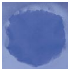
Das Nachlassen der DWR-Schicht verursacht ein klammes Gefühl.

Outdoor-Bekleidung ist häufig mit einer ultradünnen Schicht, dem sogenannten DWR (Durable Water Repellent), beschichtet. Diese Beschichtung verhindert, dass das Wasser vom Gewebe absorbiert wird und sorgt für ein Abweisen des Wassers. Durch den Gebrauch der Kleidung wird diese Schicht nach und nach abgetragen und Regen oder Schnee können in die äußeren Schichten des Gewebes eindringen. Die Kleidung fühlt sich klamm an, weil Körperwärme und -feuchtigkeit an das Gewebe abgegeben werden. Dies kann sogar dazu führen, dass sich Feuchtigkeit an der Innenseite des Gewebes niederschlägt. Die Kleidung fühlt sich nass an.